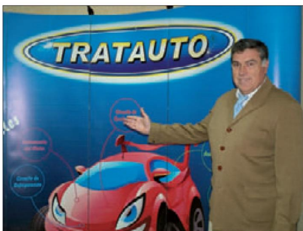
"La cultura que tenemos en España en cuanto al cuidado del automóvil está muy lejos del cuidado que se tiene en otros países."

faltar en la bolsa de herramientas del taxista.